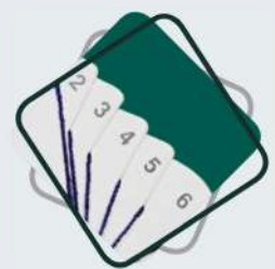
EXEMPLO 2 | EJEMPLO 2