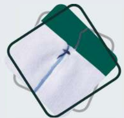
EXEMPLO 1 | EJEMPLO 1